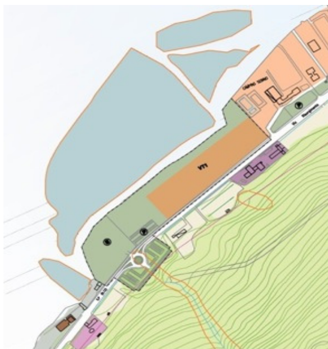
VT1 Zona per villaggi turistici

L'area destinata alla nuova struttura ricettiva è situata tra l'arteria stradale Iseo-Paratico e il lago, andando a interessare l'ultimo lembo di natura che attualmente spezza un continuum edificato lungo la sponda lacuale.