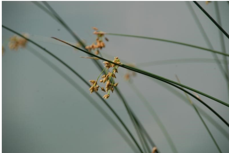
Schoenoplectus lacustris

I monitoraggi futuri andranno a confermare la presenza o l'estinzione di tutte le specie di pregio individuate in passato nella Riserva, permettendo sia di definire con precisione la gravità del processo di banalizzazione in atto, sia di progettare interventi ad-hoc per il recupero della fitodiversità perduta.