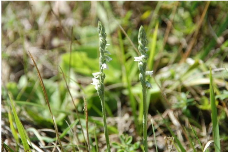
Spiranthes spiralis