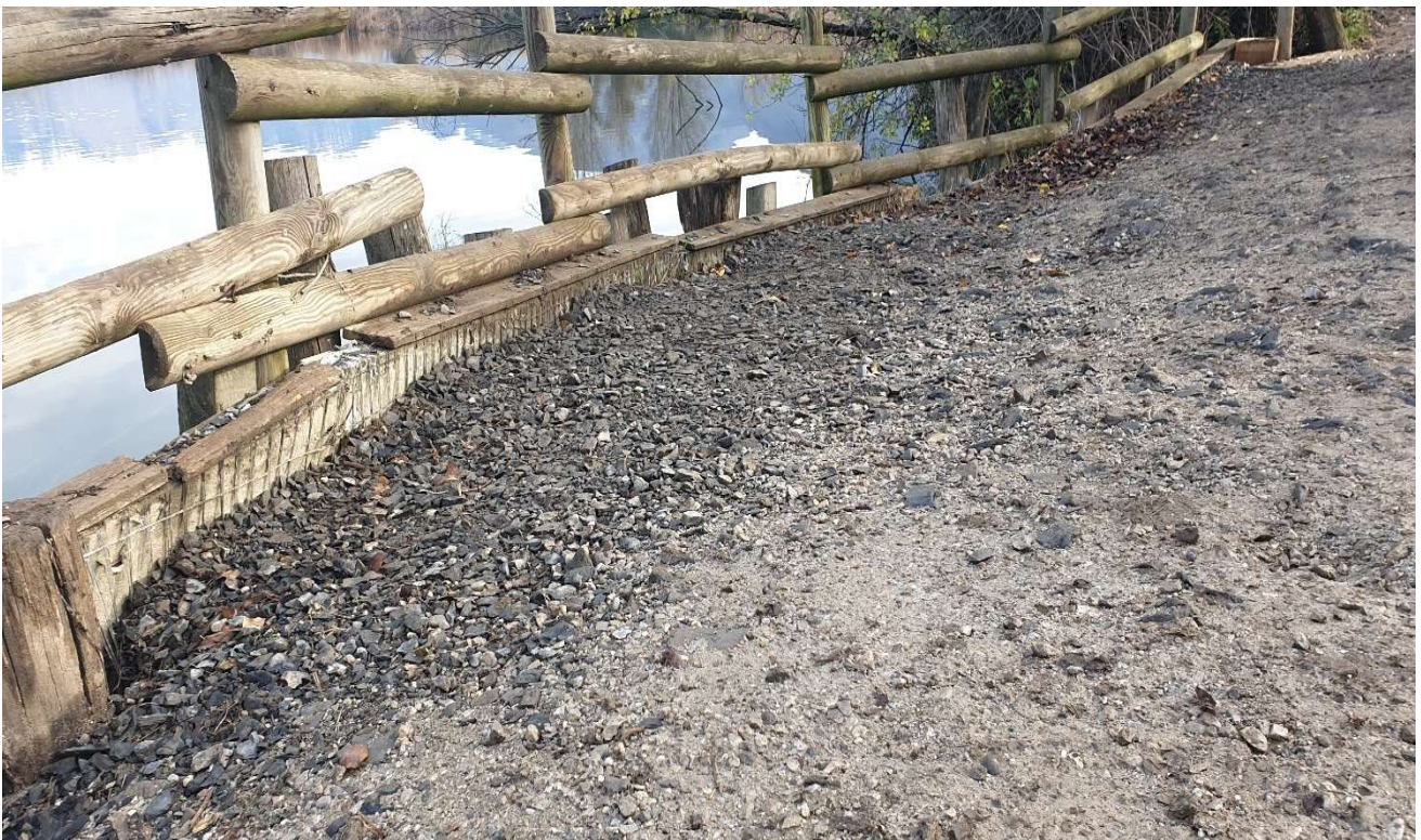
Figura 2: Affaccio presente a ovest della Lama: la briglia si è svuotata a causa del fatto che le palizzate spondali risultano ammalorate.

Preventivamente alle lavorazioni connesse al rifacimento delle palizzate, dovrà essere inoltre compiuta una pulizia vegetazione dell'area, per sradicare le piante infestanti.