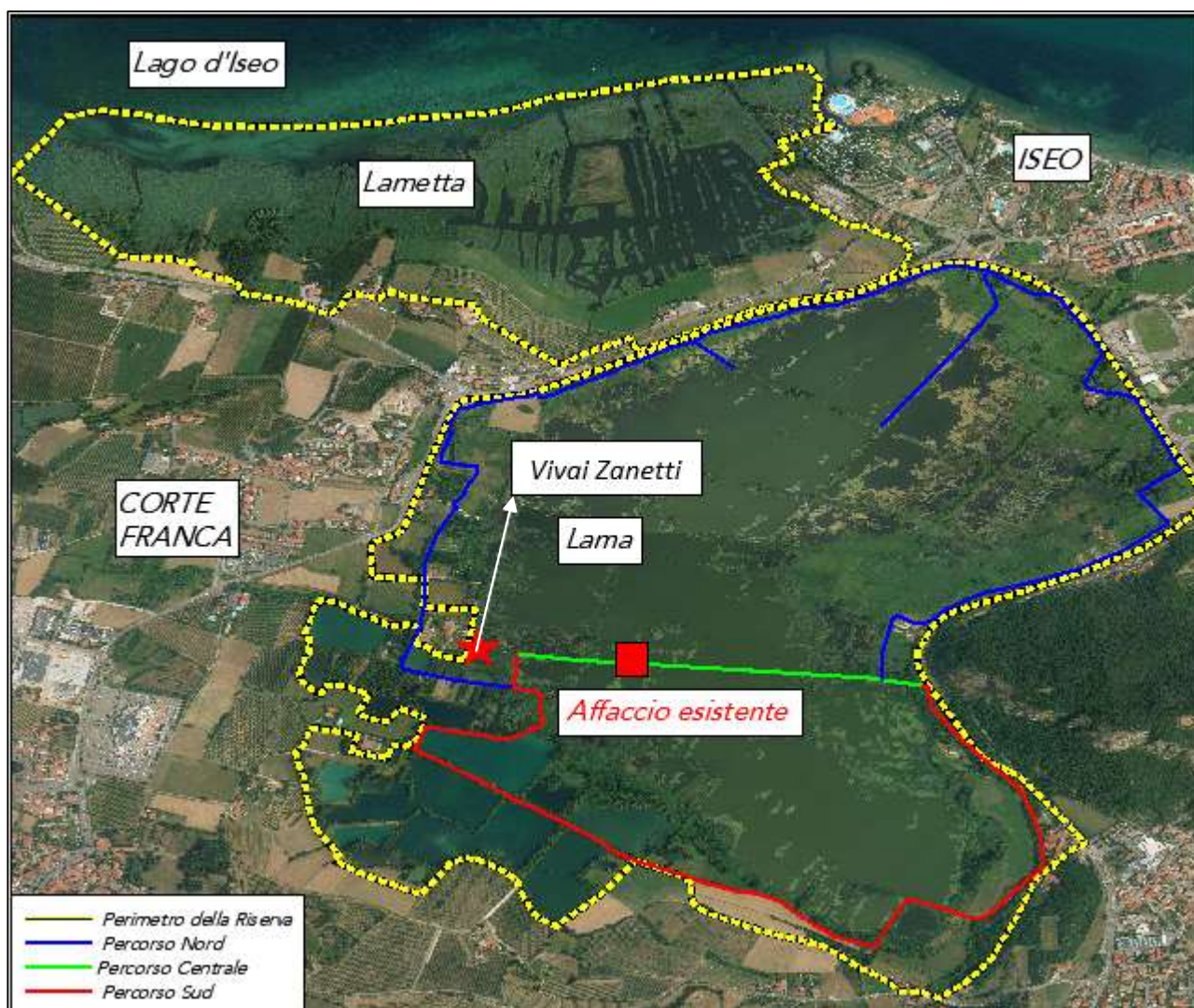
Figura 8: Planimetria di cantiere.

La chiatta verrà poi trainata con un’idonea imbarcazione nel punto in cui dovranno essere eseguiti i lavori. Gli altri interventi invece, non necessitano di particolari logistiche di cantiere.