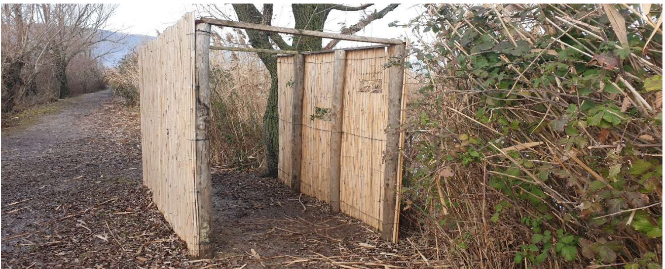
Figura 5: Tipologico delle quinte per osservazione avifauna presenti nella Riserva.

La quinta per il birdwatching avrà uno sviluppo di 10 ml, e sarà costituita da un telaio portante in pali di castagno scortecciato diam. cm 12/15, con punta trattata per l'interramento, per un'altezza totale di 2,50 m, di cui 2 m fuori terra e listelli perimetrali e trasversali posizionati sull'estremità dei pali, in legno di castagno segato di sezione cm 7x4.