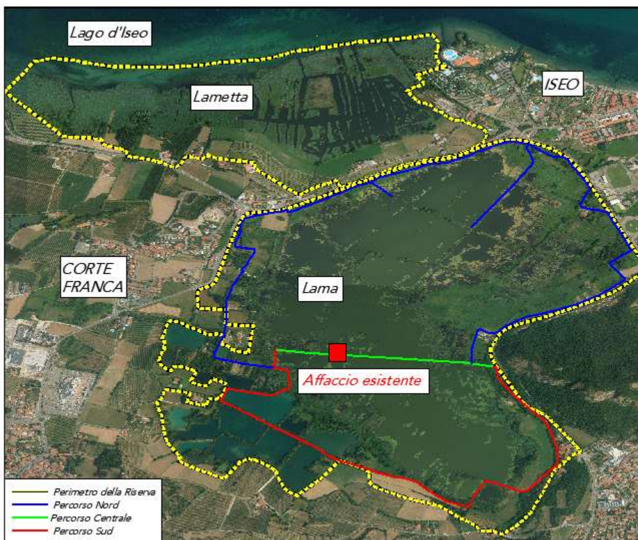
Figura 1: Inquadramento corografico della Riserva Naturale delle Torbiere del Sebino e localizzazione della briglia erosa esistente.

Per quanto riguarda il rifacimento della palizzata, volendo mantenere le tipologie costruttive che sono presenti oggi, il progetto prevede la realizzazione di nuove opere di rinforzo spondale con pali discontinui infissi sul fondale delle Torbiere. Tali palizzate saranno costituite da pali montanti infissi della lunghezza di 6 m, e da una graticciata di pali orizzontali e verticali inglobante materiale grossolano per ulteriore consolidamento.