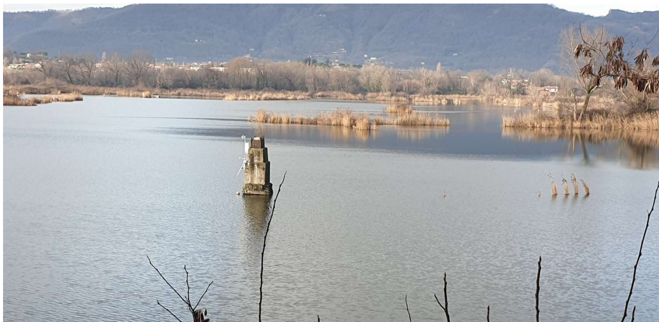
Figura 7: Vista della stazione meteo nello stato di fatto.

Al fine di rilevare e monitorare nel tempo vari parametri delle componenti abiotiche della Riserva, si prevede di configurare un sistema di monitoraggio, fornendo nuovi sensori quali un anemometro, un termoigrometro, un piranometro, un sensore di livello igrometrico, un pluviometro ed un termometro, ed integrandoli alla stazione meteorologica esistente.