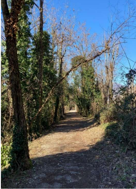
Figura 6: Robinie pericolanti lungo la strada di accesso.

Tel: 030 9823141 Mail: info@torbiere.it PEC: torbiere@pec.torbiere.it