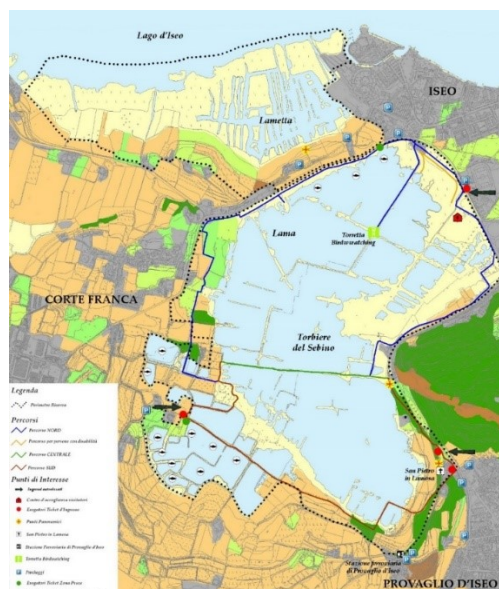
Figura 1: Mappa Riserva

La Riserva Naturale Torbiere del Sebino appartiene al territorio di tre comuni - Iseo, Provaglio d'Iseo e Corte Franca - per una dimensione complessiva di 360 ettari.