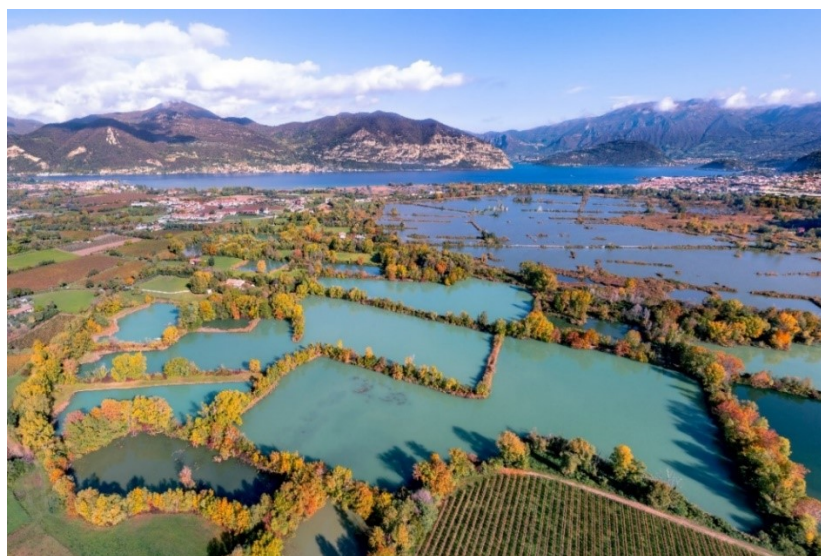
Figura 2: Vista delle Torbiere dall'alto

La Riserva, dichiarata “Zona umida di importanza internazionale” secondo la Convenzione di Ramsar, “Zona Speciale di Conservazione” (ZSC) e “Zona di Protezione Speciale” (ZPS) nell’ambito della Rete Natura 2000, è considerata un’area prioritaria per la biodiversità nella Pianura Padana Lombarda. Ciò si deve alla varietà di habitat e di specie acquatico-palustri pregiate, rare o a rischio di estinzione in Lombardia e in Italia o di interesse comunitario presenti nel territorio. Si tratta di una zona umida composta prevalentemente da canneti e specchi d’acqua. Una parte della Riserva, quella più esterna denominata Lamette , è direttamente interconnessa con il lago d’Iseo, mentre la parte più interna, formata da grandi vasche intervallate da sottili argini di terra denominata Lama , è connessa con la parte più esterna da un canale regolatore. Quest’ultima area della Riserva è fruibile dai visitatori attraverso percorsi naturalistici.